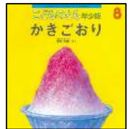
『かきごおり』 樺山祐和/さく 福音館書店より

れいとうこで つくった こおりを かきごおりきに いれて、 ハンドルを まわすと…。 (由)