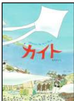
『カイト Wherever the Wind Blows』 石川えりこ/作 講談社より