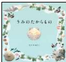
『うみのたからもの』 たかおゆうこ/作 講談社より

海辺のちいさな貝がらに 焦点をあて、その歴史や 物語に思いをはせた、す ばらしい空想の世界が描 かれています。ひとつ手 にとってゆらしたり、耳に あてたりすると(紙面上 で)、期待以上の景色が みられます。海の青さも 心に残る、夏にぴったりの 絵本です。(由)