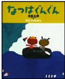
『なつはぐんぐん』 五味太郎/作 小学館より