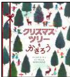
『クリスマスツリーをかざろう』 パトリシア・トート/文 ジャーヴィス/絵 なかがわちひろ/訳 BL出版より

クリスマスツリーの かざり つけは、ツリーにする 木を えらぶことから はじまります。 えらんだら、いそいで いえに もってかえり、おく ばしょを きめ、ツリースタ ンドに たてて、みずを たっ ぷり やります。かざりを たくさん あつめたら、いよ いよ かざりつけ スタ ート！ですが…。(由)