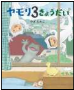
『ヤモリ3きょうだい』 やぎたみこ/作 理論社より