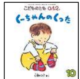
『くーちゃんのくつた』 山田ゆみ子/さく 福音館書店より