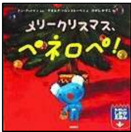
『メリークリスマス、ペネロペ』 アン・グットマン/ぶん ゲオルグ・ハレンスレーベン/え ひがしかずこ/やく 岩崎書店より